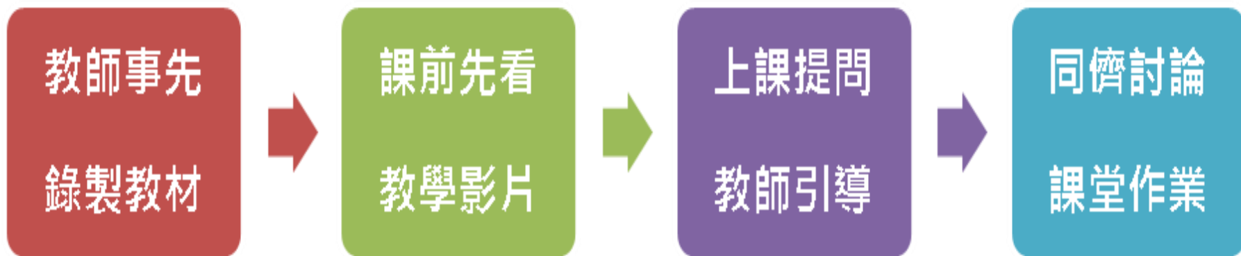
圖1 翻轉教學四步驟